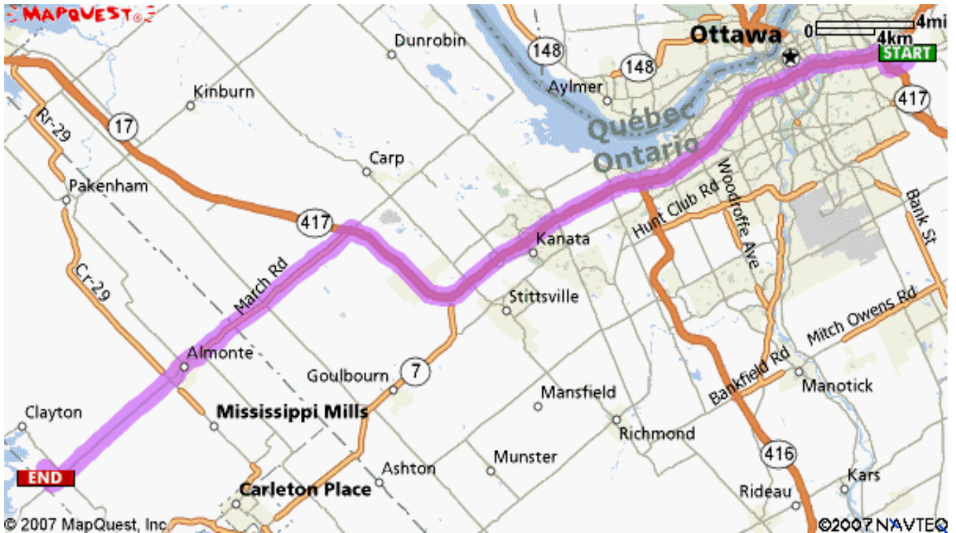
MAP #1 –FROM OTTAWA

Sunday – Mississippi Veterinary Services, 2789 Hwy 29.S, Pakenham (613)624-5554